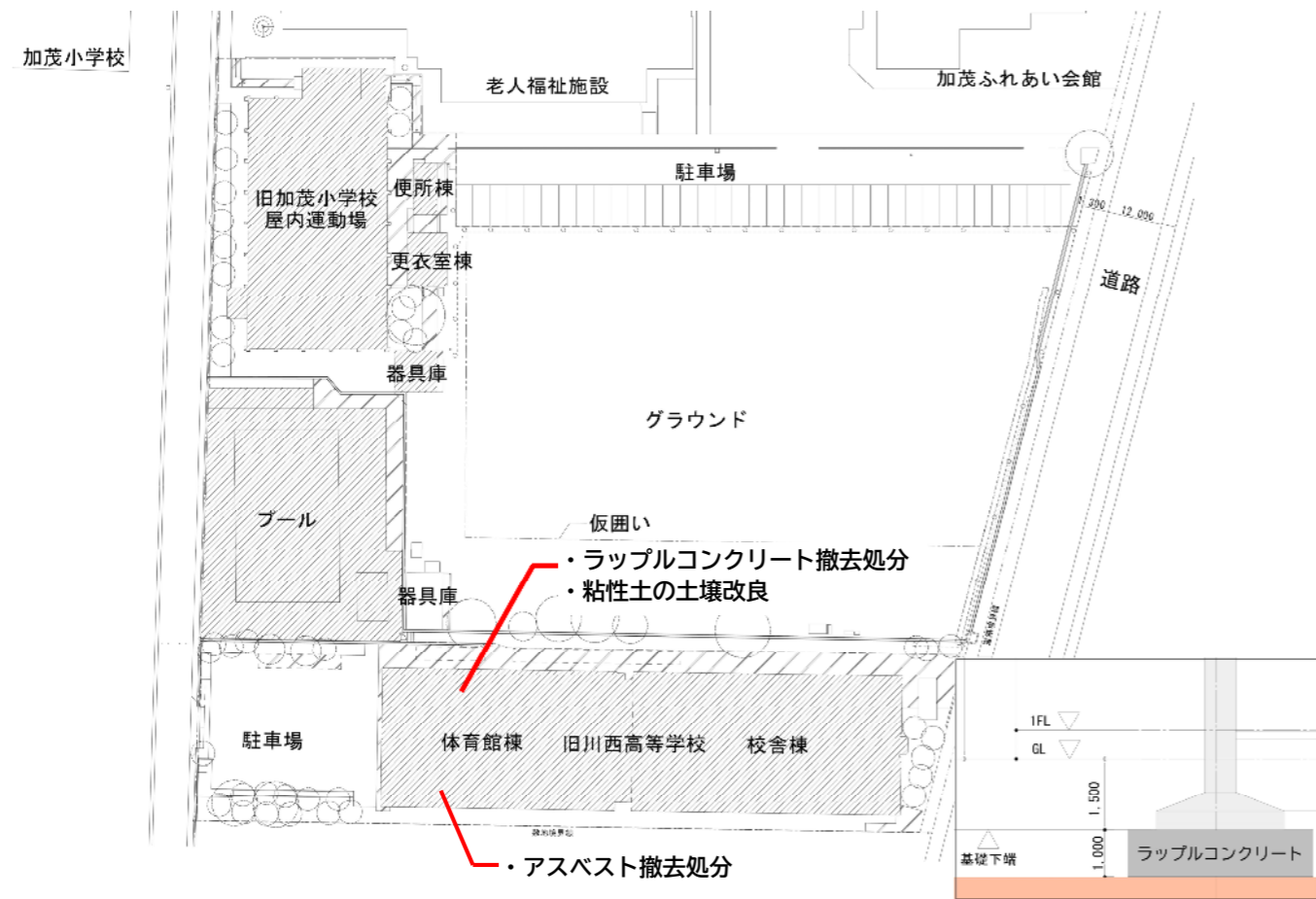
ラップルコンクリート模式図 (断面図)