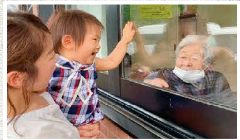
昨年度の入賞作品 テーマ「続コロナ禍」