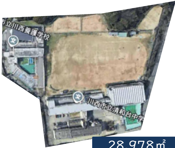
清和台中+川西養護