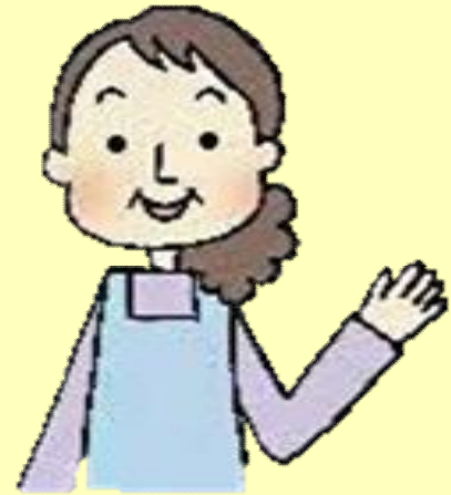
生活支援者 ゴミ出し・買い物など