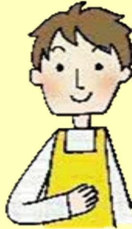
コーディネーター