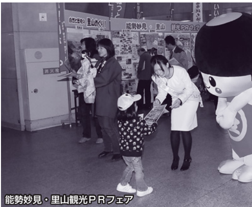
能勢妙見・里山観光PRフェア

その要因には、年度途中からの実施に加え、希望調査やPRが不十分であったことを考慮し、延長育成の希望調査書と利用申請書をつつの様式に改めたほか、幼稚園や保育所への案内文書の配布などに取り組んだ結果、21年度では、9クラブで延長育成が実施されており、利用者数も約3倍に増加した。