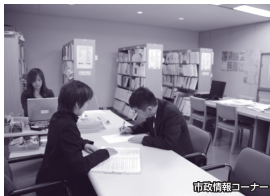
市政情報コーナー

市民や市内事業所からの請求については、この手数料を無料としている近隣市もあるが、本市では、公的な役務の提供に対する受益者負担の考えのもと、営利目的などによる制度の乱用防止の観点も踏まえ、手数料を徴収しているところである。