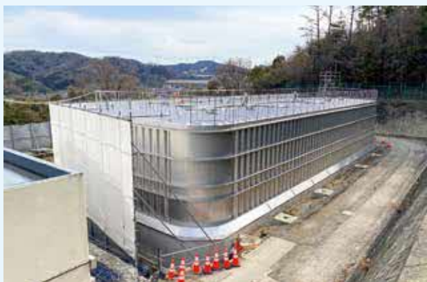
けやき坂配水池の耐震化工事