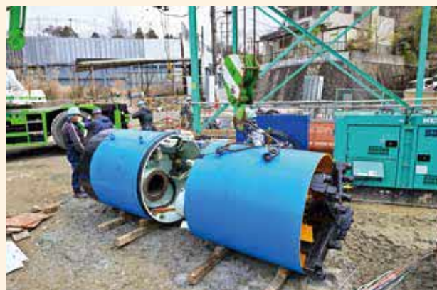
鼓が滝3丁目などの雨水管の整備工事