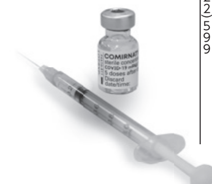
7月の集団接種案内一覧

国から詳しい内容が発表され次第、実施方法などを市ホームページや広報紙でお知らせします。