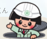
下水道きんたくん