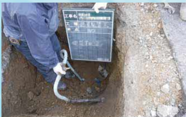
鉛製給水管の更新