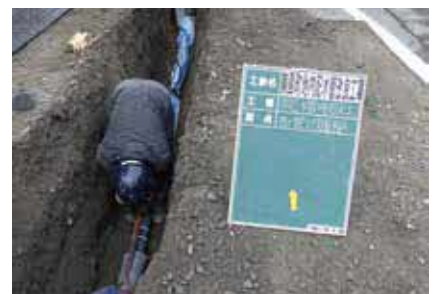
老朽化した配水管の改良工事

耐震化工事 清和台、山原地内など 改良工事 中央町地内 布設工事 美園町、日高町地内など 設計委託 水管橋基本設計 3億3,294万円