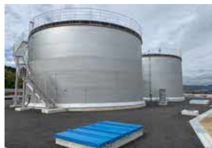
清和台低区配水池

耐震化工事 けやき坂配水区 改良工事 一庫中区配水池 調査委託 大和高区ポンプ棟など 1億6,802万円