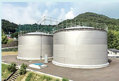
清和台配水池築造工事