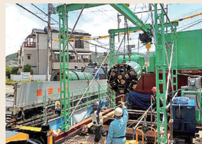
矢問5号雨水幹線管渠築造工事