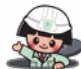
下水道きんたくん