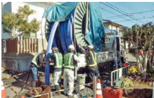
下水道管きょ長寿命化工事