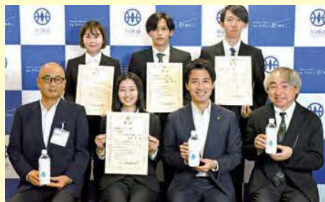
シュリンクラベルデザイン授賞式

令和4年8月5日に、川西市役所市長応接室にて、災害備蓄水のシュリンクラベルデザインの授賞式が行われました。