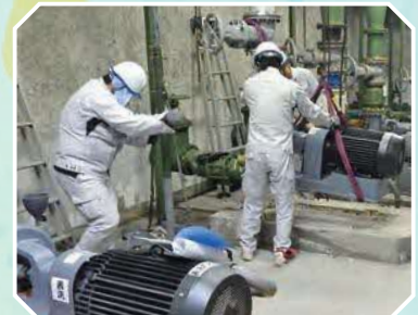
送水ポンプ改修工事