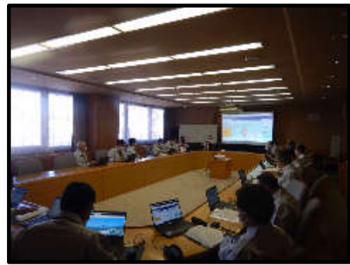
(第2回災害対策本部会議)