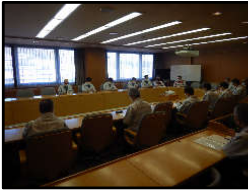
(第1回災害対策本部会議)