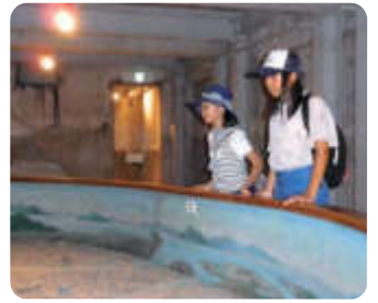
本川小学校 平和資料館にて

●国立原爆死没者追悼平和祈念館を見学し、「被爆体験朗読会」にも参加しました。朗読していただいた詩の中で一番印象に残っているのが、「おとうちゃん」という詩です。この詩の「せんそつがなかったら、おとうちゃんはんはしななかつたら」という所を聞いて、おとうさんを亡くした子どもの絶望感が伝わってきて、二度と戦争を起してはならないと強く感じました。(戸口) ●広島平和記念資料館では原子爆弾が投下された時のことから今までのことが詳しく記されていました。なかには、目をむむってしまうものや、言葉を失ってしまうものもありました。だからして目をそむけずに、あの日あの時何があったのかを知ること、戦争の悲惨さ、恐ろしさを学ぶことができました。(石津)