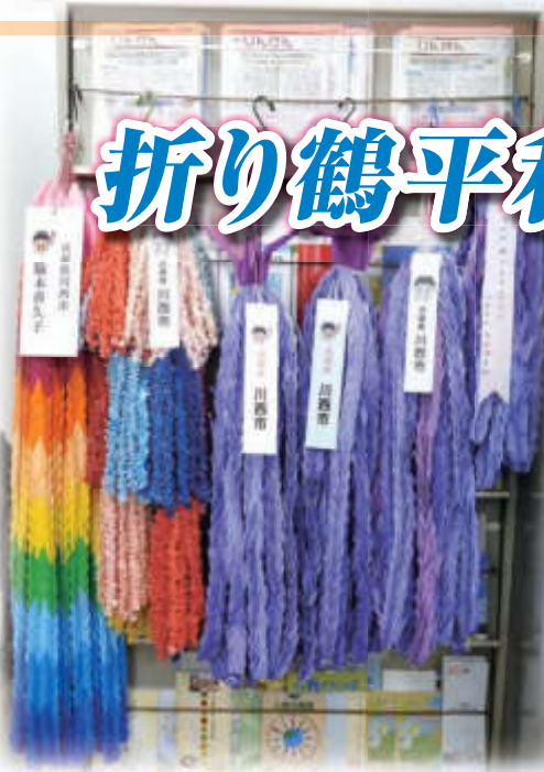
市民から寄せられた約1万5千羽の折り鶴

川西市では、非核平和都市宣言の趣旨にのっとり、市民平和推進事業として、毎年「折り鶴平和大使」派遣事業を実施しています。この事業は、今回で、15回目となりました。