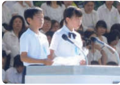
子ども代表の平和への誓い

●式典にはものすごく多くの人が参列していました。私の前の席の人は外国の方でした。他にも多くの外国の方を見かけました。国をへだてても戦争や平和について考えている人がたくさんいるのだなと改めて実感しました。こども代表の平和へのちかいで「平和とは、夢や希望を持てる未来があること」と言っていて、とても共感できました。世界では争い事がなくなりません。世界中の人々が平和になってほしいと私は願います。(戸口) ●早朝にも関わらず、平和記念式典は人であふれかえっていました。なかには外国の人や、若い人などいろいろな人が来ていました。世界中の人々が平和問題についてよく考え、よく知り、ちゃんと向き合っていました。私は、平和宣言や平和への誓いを聞いて、知って考えるだけじゃなく、知ったうえで、考えたうえでどうしたいかを行動にうつしたいと思いました。(石津)