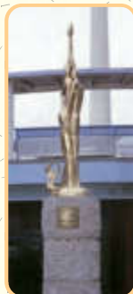
▲川西市の平和モニュメント「瞳」(下ウ)