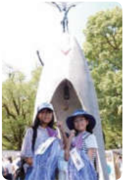
原爆の子の像の前で

2人の大使は、8月6日に広島市で開催されました平和記念式典に市民の代表として参列するとともに、市民が平和への願いを込めて折ったりんどう色の折り鶴を平和公園の原爆の子の像に捧げてきました。