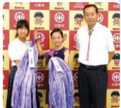
市長から折り鶴を託される2人