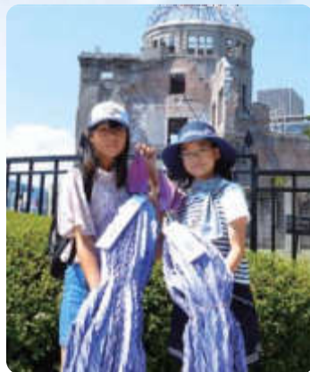
原爆ドーム前にて

● 原爆ドームの建て物の下は、あれから73年もたった今も、がれきやれんがの破へんが辺りにちらばっていて、時が止まってしまっているようで、きょうふを感じました。改めて戦争は絶対になくさないとけないと思いました。(戸口)