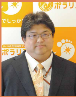
日本デイサービス協会 理事長 （株）ポラリス代表取締役