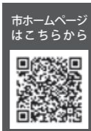
市ホームページはこちら

対象=①4年4月分の児童手当か特別児童扶養手当を受給した4年度住民税非課税世帯(申請不要。7月下旬に振り込み予定)②平成16年4月2日～19年4月1日生まれの児童のみを養育する、主たる生計維持者が4年度住民税非課税の世帯③コロナ禍の影響で住民税非課税相当となった世帯