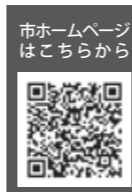
市ホームページはこちら

対象者の詳細や申請方法など、詳しくは市ホームページ(右の2次元コードからアクセス可)へ。