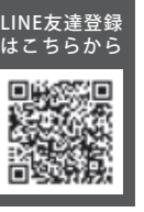
LINE友達登録はこちら

毎週水曜日の正午～午後4時と毎週金曜日の午後4時～8時。受け付け時間は、終了時間の30分前まで。祝日も実施しています(年末年始除く)。