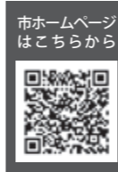
市ホームページはこちら

なお、申請者が15歳未満か成年被後見人の場合、予約は法定代理人が行ってください。申請時にも同行が必要です。