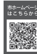
市ホームページはこちら

なお、50歳未満の人は、世帯主の所得に関わらず、本人と配偶者の所得によって保険料の納付が猶予される場合があります。