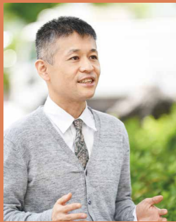
あいな清和苑 在宅部部长 ケアマネジャー

要介護状態の人が減り、介護や医療の費用を削減できれば、社会保障制度の持続可能性が担保されます。そうすると、その分の予算を、まちづくりや子どものために生かせるようになりますよね。高齢者が元気になることは、まち全体を活気づけることにつながるはずですよ。