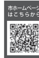
市ホームページはこちら