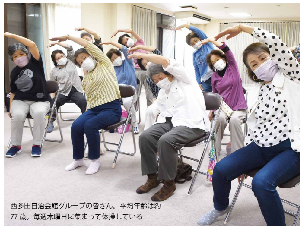
西多田自治会館グループの皆さん。平均年齢は約77歳。毎週木曜日に集まって体操している

市内で、活発に行われている「きんたくん健康体操（転倒予防・いきいき百歳体操編）」。現在、各地域で40グループが自主的に活動。地域の高齢者同士で集える機会にもなっています。