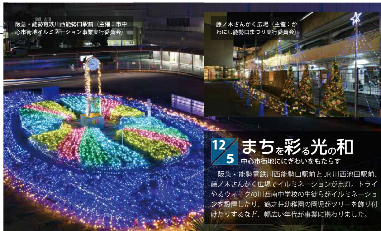
阪急・能勢電鉄川西能勢口駅前（主催：市中心市街地イルミネーション事業実行委員会）