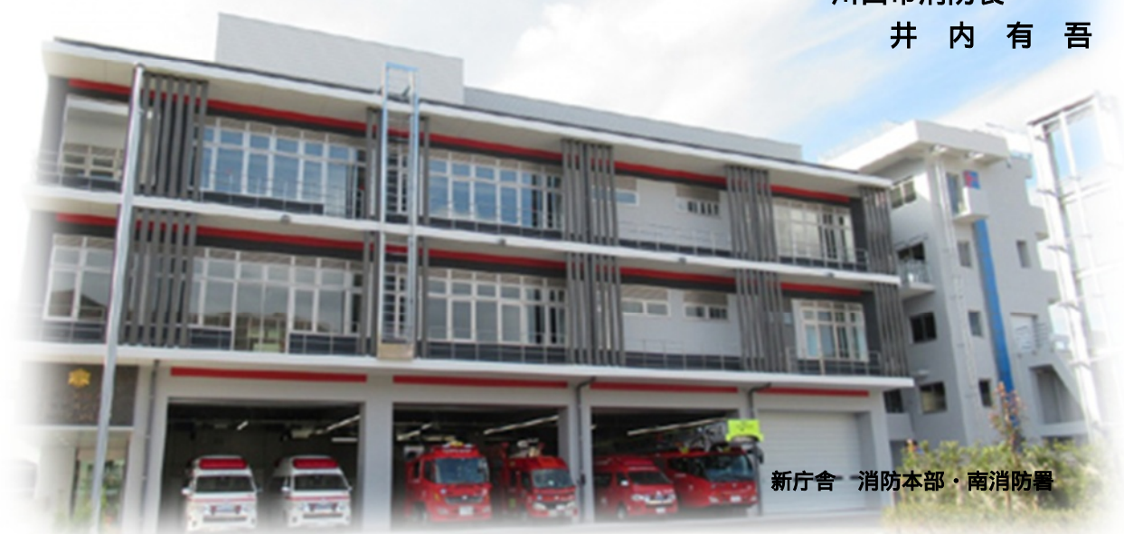
新庁舎 消防本部・南消防署