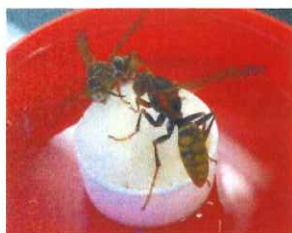
セグロアシナガバチ