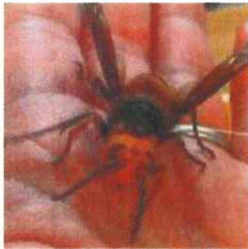
スズメバチの雄

【スズメバチ】 スズメバチは、ハチのなかでもおおむね20～40mmと最も大きく、巣に近寄るだけで、攻撃を仕掛けてくることがあります。スズメバチは、4月ごろから11月にかけて、きれいなマーブル模様の丸い巣を作ります。冬になると新女王バチ以外はすべて死んでしまい、新女王バチが土中や朽木などで越冬します。巣は1年で使い捨てられ残った巣は、翌年に利用されることはありません。（雄には針がありません。）