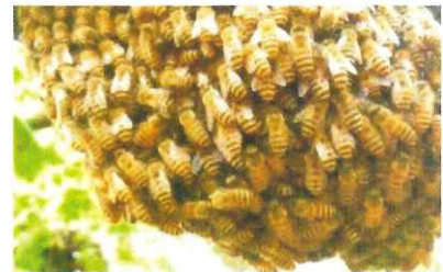
ミツバチ

【ミツバチ】 ミツバチは、12mm前後と小さく、春になると古い巣は新女王バチが引きつぎ、女王バチと働きバチの一部が新しい巣を作るために巣分かれ(分封)します。木の枝などに女王バチを中心として働きバチが塊となり、新しい巣を作るのに条件のよい場所を探す行動をとります。よい場所が見つかるまで数時間から数日の間、同じ場所に群れます。分封の間は攻撃性がないため、そのままにしておきましょう。ミツバチはむやみに人を攻撃してくることはありません。