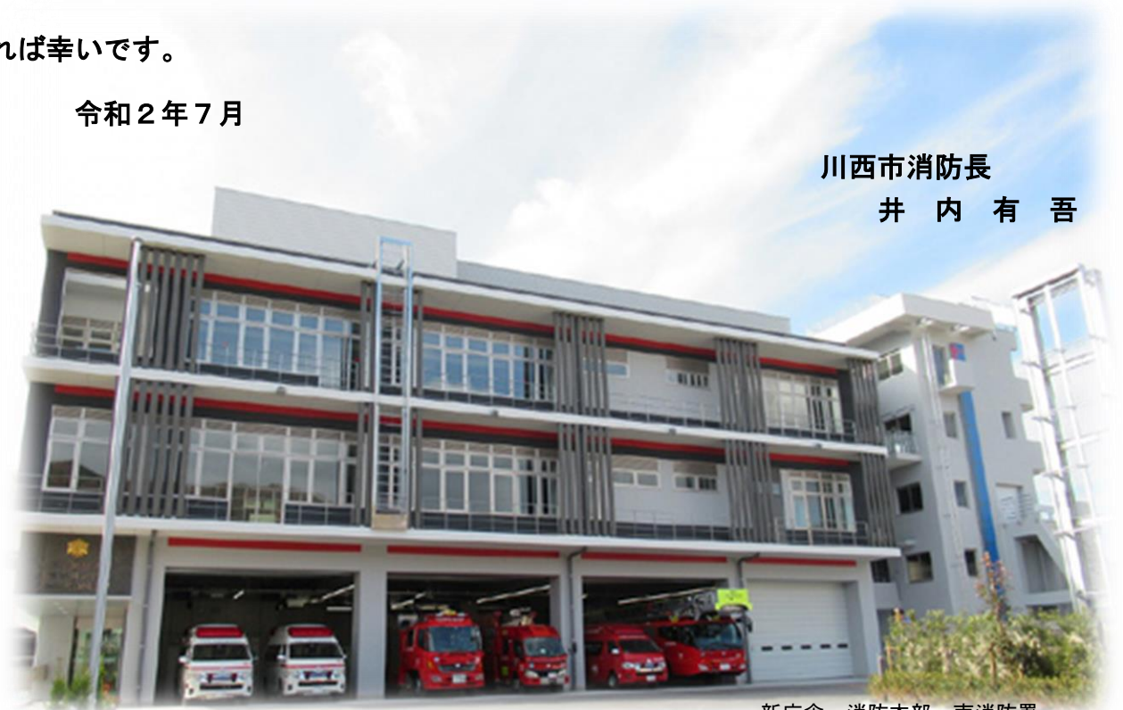
新庁舎 消防本部・南消防署