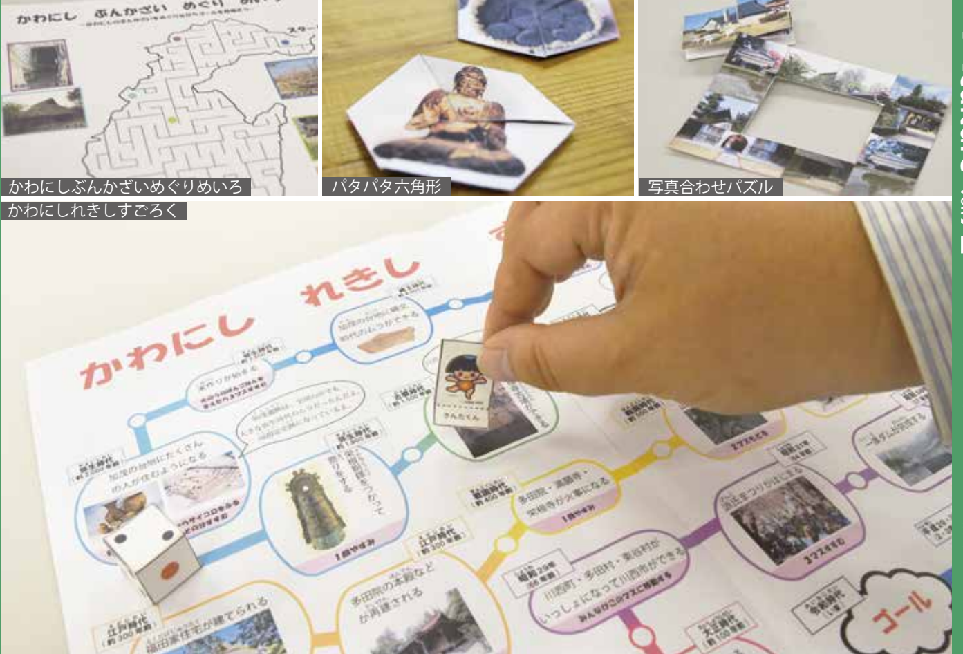
かわにし ぶんかざいめぐりめいろ かわにしれきしすごろく