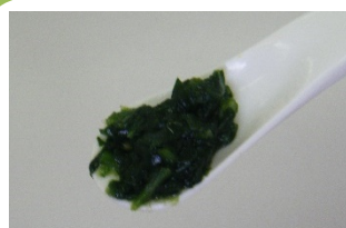
ほうれん草みじん切り