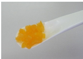
にんじんみじん切り