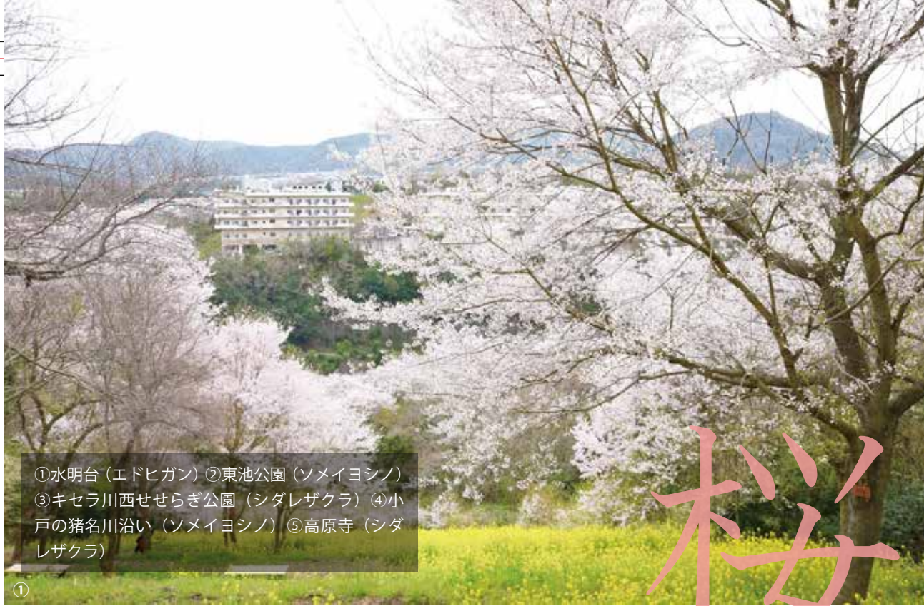
①水明台（エドヒガン）②東池公園（ソメイヨシノ） ③キセラ川西せせらぎ公園（シダレザクラ）④小戸の猪名川沿い（ソメイヨシノ）⑤高原寺（シダレザクラ）