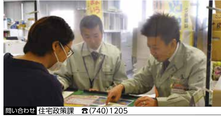
問い合わせ 住宅政策課 ☎(740)1205

NPO法人「兵庫空き家相談センター」の相談員が空き家の相続や管理、売買など、空き家に関する不安や悩みを解決するための相談を受け付けます。定員は4組（1組30分）、先着順。申し込みなど詳しくは住宅政策課へ。