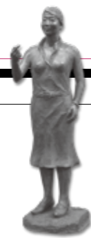
平成30年度市美術協会賞 「若かりし頃」