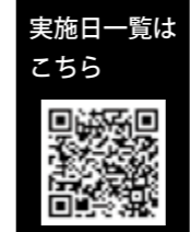
実施日一覧は こちら

9月30日(月)までに同通知書が届 いていない場合は、学校教育課へ。 就学を希望する外国籍の人は、事前 に市役所3階の学務課へ。