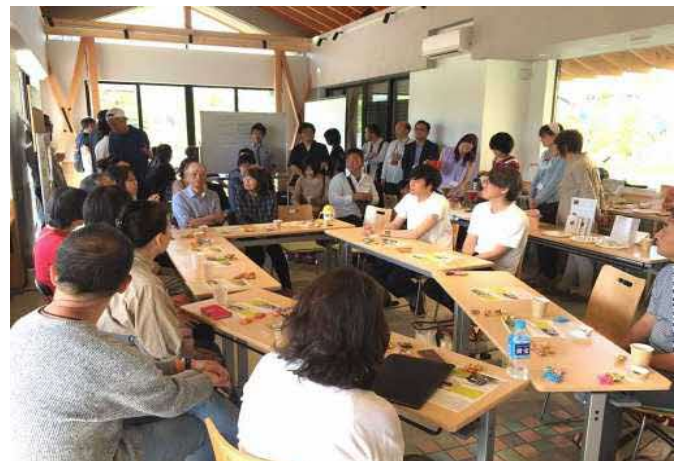
キセラ★カフェ (キセラ丸 オープニング時)