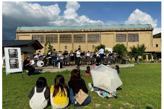
ステージイベント