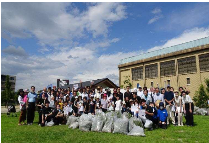
メンテナンスイベント