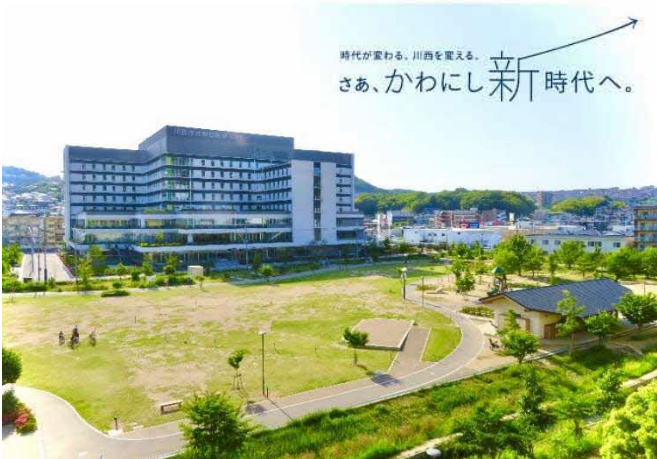
キセラ川西せせらぎ公園 概観