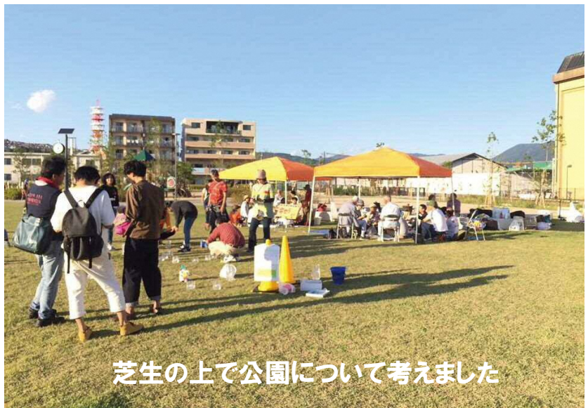
芝生の上で公園について考えました

今後も、誰でも気軽に参加して公園について話ができる…そんな「キセラ・カフェ」の運営をめざします。