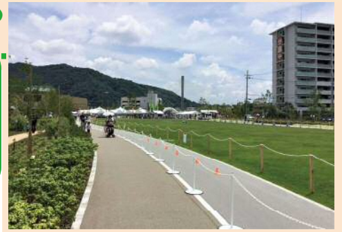
芝生広場とジョギングコース