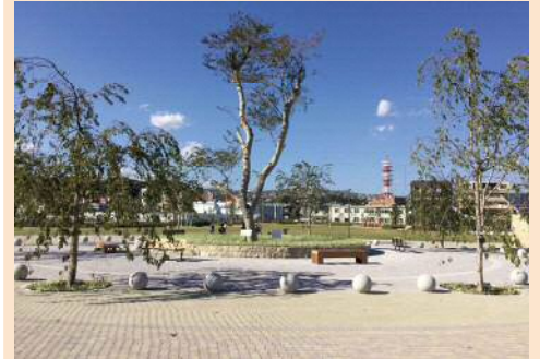
公園のシンボルツリーのエドヒガン