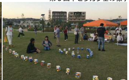
かわにし音灯りの点灯実験とお話し