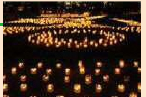
かわにし音灯りの様子 (写真：かわにし音灯りホームページより引用)

せせらぎ遊歩道に流れる水路にホタルが舞うよう、ホタルの生態を学んだり、水路で水生生物の観察ワークショップ等を行っています。