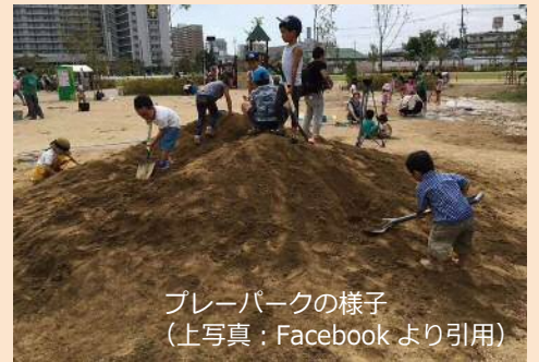
プレーパークの様子