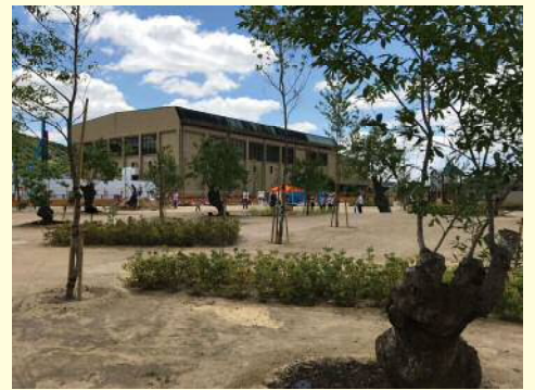
▲キセラ川西せせらぎ公園から総合体育館を望む