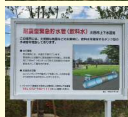
耐震型緊急貯水管（飲料水）