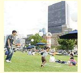
▲大阪市中之島公園