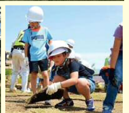
芝張りワークショップの様子