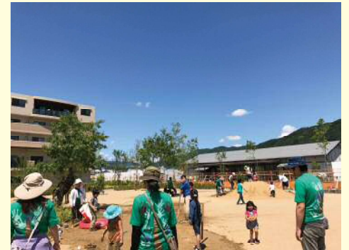
▲キセラ川西プレーパークの様子