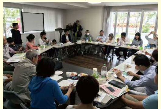
▲第1回キセラ★カフェの様子