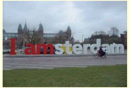
▲シビックプライドのキャンペーン（アムステルダム）

公共空間での生活の質を高めることが、まちの魅力を高めることにつながる。パブリックライフが充実することでまちが大きく変わる。公園でのイベントや、日常的な人と人のふれあいが、社会生活において重要であり、都市の一番の魅力となる。