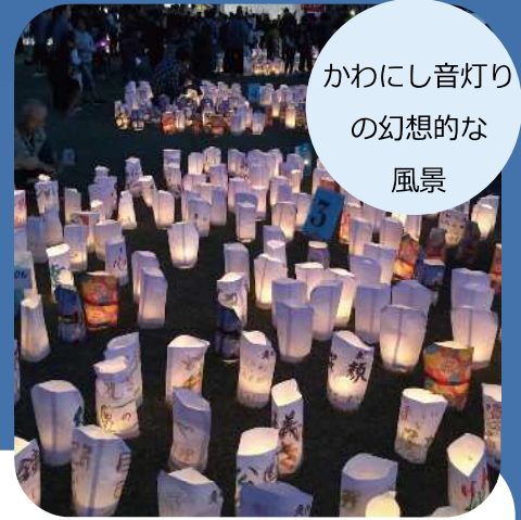
かわにし音灯りの幻想的な風景

ブースには、これまでの活動内容を発信するためのパネル展示や、メンバーが作った近隣の散策コース紹介、遊び場等をしつらえました。