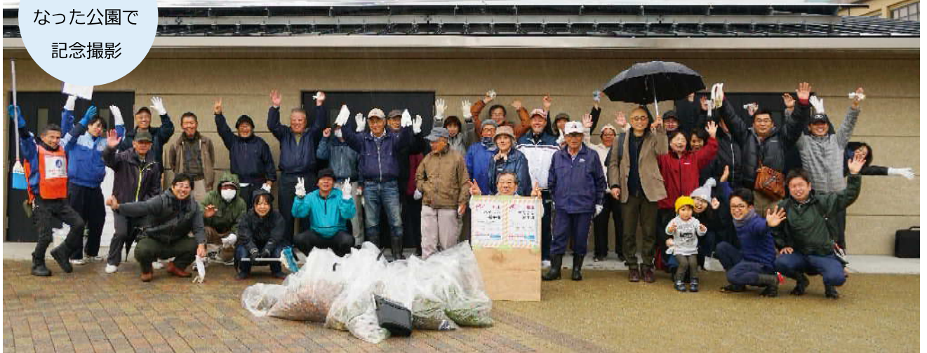
ピカピカに なった公園で 記念撮影

市民発案のこの企画、昨年に引き続き2回目の公園の大そうじイベントです。雨天にもかかわらず、キセラ★カフェの常連さんはもちろん、日頃公園を利用されている多くの方の参加がありました！公園はピカピカになったぞー！！