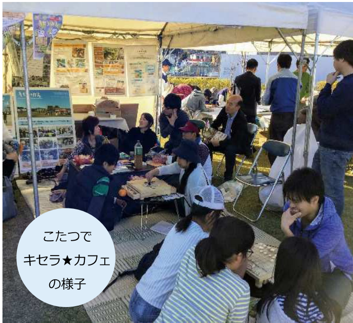
こたつで キセラ★カフェ の様子

キセラ川西では、快適な環境づくりや地域活力の増進などをめざしてエリアマネジメントに取り組んでいます。キセラ川西せせらぎ公園は、エリアマネジメント活動の中心となる舞台です。ここで多様な市民プログラムや活動が行われることでまちの魅力が高まるように、市民参画による取り組みを進めています。