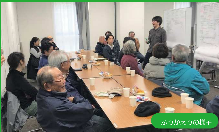
ふりかえりの様子