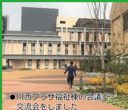
●川西プラザ福祉棟の会議室で 交流会をしました

川西プラザ福祉棟の会議室に移動して、参加者で今回の大そうじのふりかえりをしました。気づきや発見、今後に向けて…等多くの意見ができました！