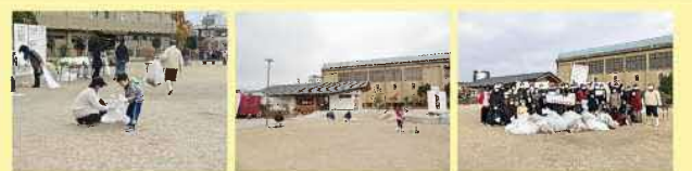
↑ 昨年のメンテナンスイベントの様子

キセラ川西せせらぎ公園をみんなで清掃する「メンテナンスイベント 大そうじ選手権」を開催します! ゴミ拾いや草引きを実施します。