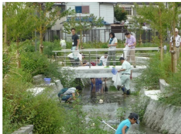
せせらぎ水路での水生生物観察会