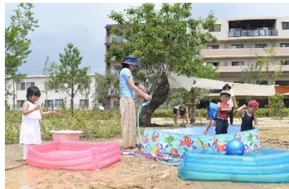
里庭エリアでのプレーパーク活動