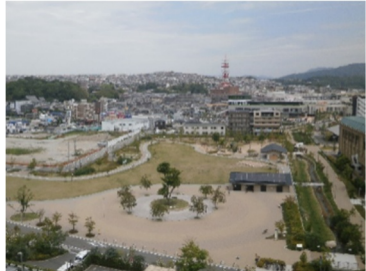
キセラ川西せせらぎ公園及びせせらぎ遊歩道