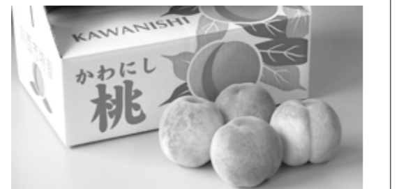
問い合わせ 産業振興課 (740)1164

昨年の台風で、市内の多くの桃畑が被害を受けたため、販売箱数が例年の約半数まで減少する可能性があります。農家の皆さんが大切に育てた桃をできるだけ多くの方が購入できるように、ご理解とご協力をお願いします。 ▶ 販売箱数は1人1箱まで 販売数の制限を設ける予定です(当日の状況により変更の場合あり) ▶ 9時から順番確認の整理券を配布 当日午前9時から会場付近で整理券を配布しますが、購入を保証するものではありません