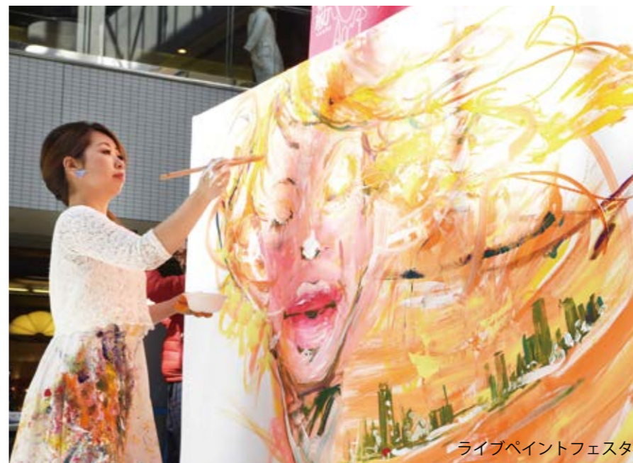
ライブペイントフェスタ

懐古行列の沿道を飾る桜ちょうちんの協賛を募集します。個人・企業の申し込み可。名前を入れ、源氏まつり開催前の約2週間点灯します。過去に桜ちょうちんを作り、所有している人は1個1,000円、新規に作る人は1個2,000円です。また、チラシに名前を掲載する協賛も同時募集。希望者は2月22日(金)までに費用を持参し、市役所2階の文化・観光・スポーツ課へ。