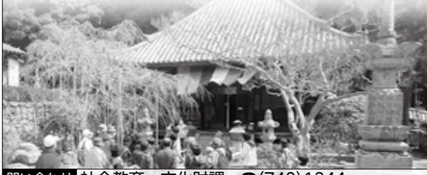
問い合わせ 社会教育・文化財課 ☎(740)1244

満願寺や雲雀丘古墳群、高碓記念館など 満願寺秘仏千手観音像拝観と境内散策後、雲雀丘古墳群や高碓記念館などを巡ります。 市・文化財ボランティアガイドの会▷時 3月18日(日)午前10時半満願寺山門前集合。午後3時半阪急電鉄「雲雀丘花屋敷」駅解散▷費 400円▷定 30人▷備 弁当持参。小雨決行▷日 3月16日(金)までに社会教育・文化財課へ