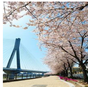
Cherry : the City Tree