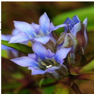
Gentian : the City Flower