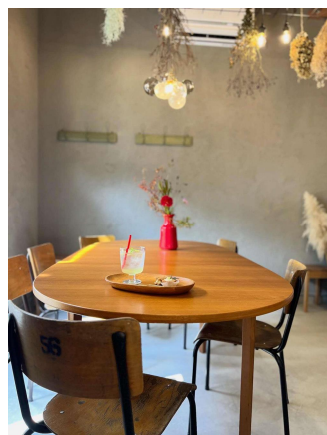
改修後の空き家の様子