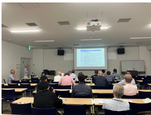
マンションセミナーの様子