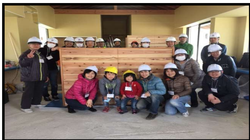
東面設置後の写真

今回作った倉庫は、パークオフィスキセラ丸の東面に設置されています。きれいに仕上がった倉庫を、是非見に来てください。