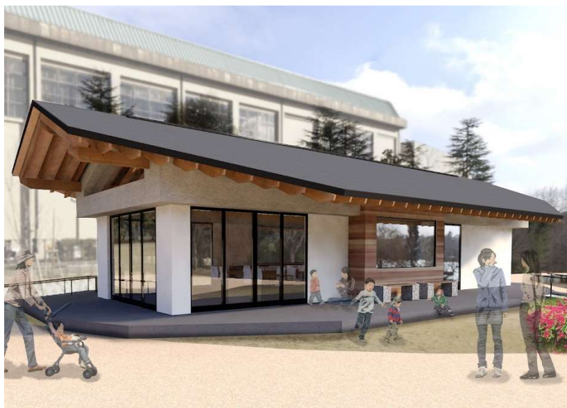
キセラ川西せせらぎ公園管理棟完成予想図