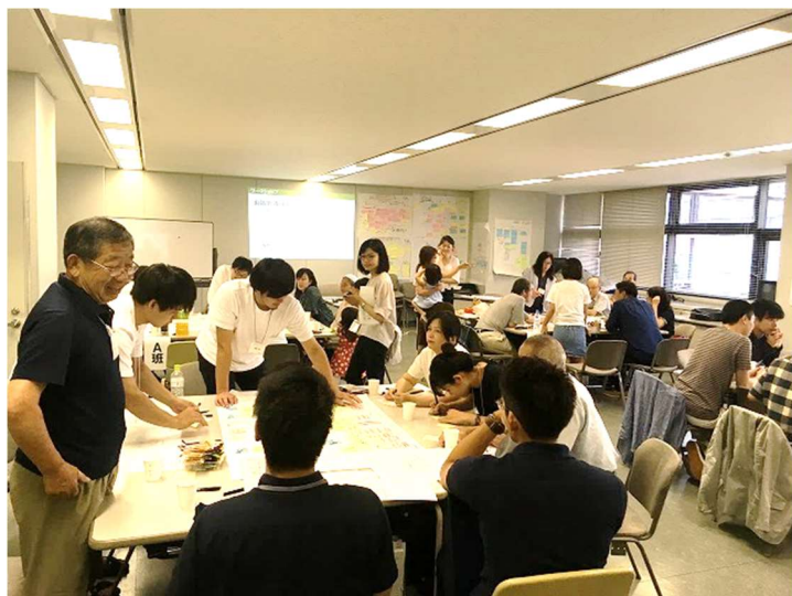
設計ワークショップの様子

キセラ川西せせらぎ公園では、これまで、シビックプライドの醸成をめざして、設計、施工及び維持管理の各ステージにおける市民参加を積極的に展開し、供用開始後においても市民参画型の公園運営に向けて、公園利活用のルール作りや、市民ワークショップによる仕組みづくりに取り組んでいます。