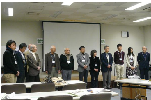
ワークショップメンバーの紹介