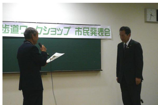
市長への「報告書」の提出の様子