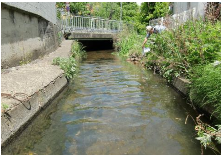
当時のようすを思わせる現在の中央北地区の水路 川西北小学校前の水路〔小川〕

昭和31年〔1956年〕頃の中央地区、今のキセラ川西一帯です。当時は、田畑が広がり、子どもたちが水路で魚やシジミ採りに興じていたことでしょう。この辺一帯は、ゲンジボタル・ハイケボタル、カワニナ、タナゴやドジョウなど多種多様な生き物が生息しています。生き物たちの「たくましさ」が現在も引き継がれています。人口増加は昭和35年頃からです。〔保存版ふるさと川西より〕