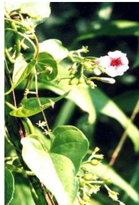
ヤイトバナ(ヘクソカズラ)