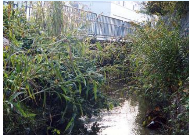
ジュズダマの群生が見られる川西北小学校前

その一部を紹介します。例えば、ジュズダマは、9～11月に花期を迎え、果実を包んでいる固い苞鞘〔ほうしょう〕をつないで数珠にしたことで名前が付けました。ハトムギはジュズダマの栽培種で、ハトムギの果実を炒ったものがハトムギ茶です。ぜひ探してみてください。