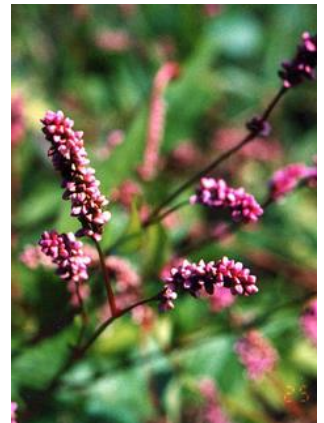
イヌタデ(アカマンマ)