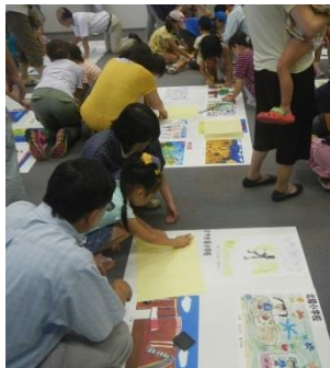
▼ポスター貼付け作業中