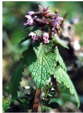
ヒメオドリコソウ