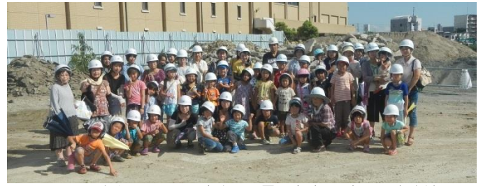
▲ヘルメットをかぶって、工事中の公園予定地にて撮影。完成前の公園の形を初めてみた子どもたちは興奮気味に見学していました