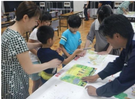
▲カラフルに子どもたちの夢が描かれたポスター146 枚

ポスターの設置予定日が夏休み中ということもあり、児童の皆さんの手でポスターを設置するワークショップを実施し、30 組ほどの親子が参加していただきました。