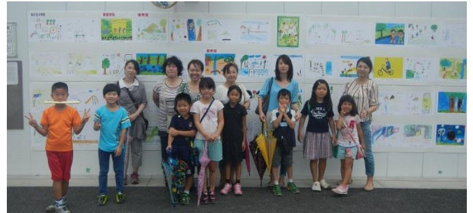
▲公園見学後に設置されたたのポスター前で記念撮影

仮囲いアートギャラリーは現在も継続して展示しております。ぜひ、上手に描かれている子どもたちのポスターを見に足を運んでみてください。