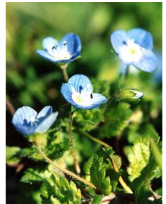
オオイヌノフグリ