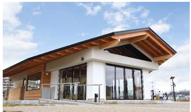
「パークオフィスキセラ丸」