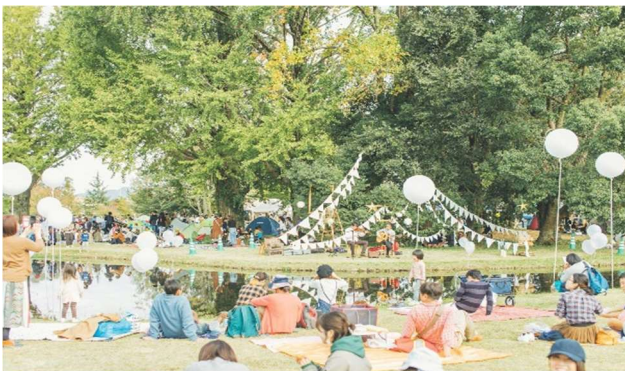
「 かかみがはら 各務原市学びの森公園」