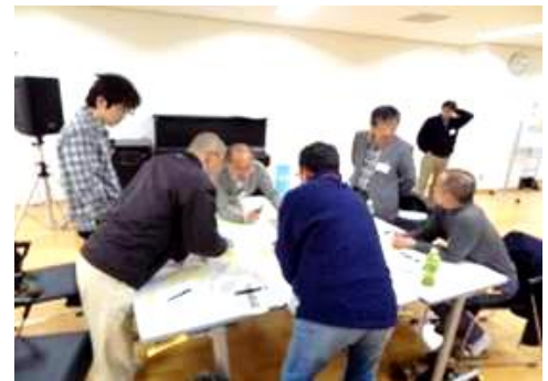
ワークショップの風景

第 3 回のワークショップは、今年度の最終回のワークショップであり、これまでの意見交換を踏まえて、「中央公園・せせらぎ遊歩道の具体的な利活用の内容について考えよう！」をテーマに開催しました。会議では、「イベント」、「自然観察・体験、子どもの遊び、文化歴史学習」、「魅力向上、みんなの公園を美しく」の個別テーマごとに 4 つの班に分かれ、どんな活動をだれがどのようにやっていくといいのか、そのためにどんな取り組みが必要かなどについて、皆さんで意見を出し合いました。