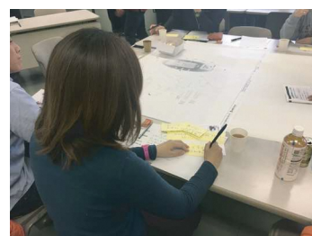
公園管理棟への想いを付箋に記入