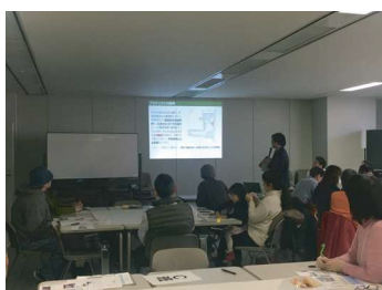
ワークショップの進め方の説明

川西市では、キセラ川西せせらぎ公園内において公園管理棟を建設するプロジェクトを進めており、このプロジェクトでは、市民のみなさんの想いを具現化した公園管理棟を市民のみなさんと一緒に建設することを目的に、設計・施工の各段階においてワークショップを開催します。去る平成30年2月24日（土）、川西市役所においてキセラ川西せせらぎ公園管理棟セルフビルドプロジェクト「第1回（設計編）公園管理棟セルフビルドワークショップ」を開催しました。本通信では、ワークショップでの意見や様子をご報告します。