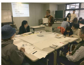
自己紹介では公園での思い出を発表