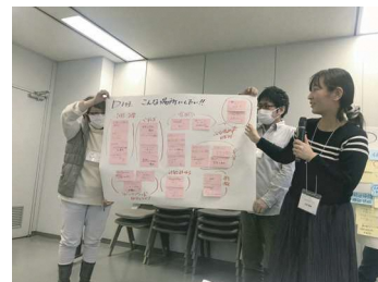
最後に各班の意見を発表