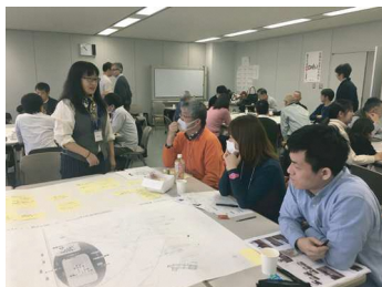
様々なアイデアや意見を班で共有