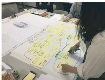
各班の意見を取りまとめ