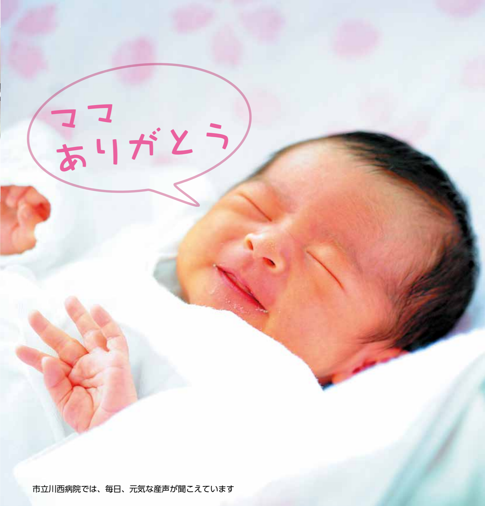
市立川西病院では、毎日、元気な産声が聞こえています