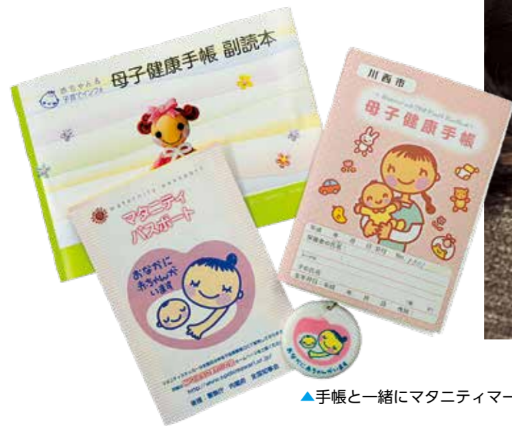
▲手帳と一緒にマタニティマークのキーホルダーも