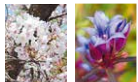
市木: さくら 市花: りんどう

市内の情報を発信中。 「いいね！」が増えれ ば増えるほど、かわに しの魅力がみんなに伝 わります。