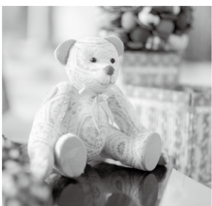
展示会の作品作りなども

『社会奉仕』のために地域の清掃や子どもとの交流、子育て支援、友愛訪問などを実施。 なお、老人クラブが結成されていない地域の方は相談してください。詳しくは長寿・介護保険課 ☎(74) 1174へ。