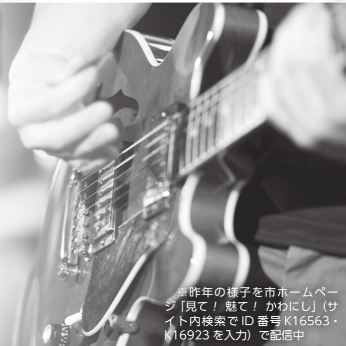
※昨年の様子を市ホームページ「見て！魅て！かわにし」(サイト内検索でID番号K16563・K16923を入力)で配信中

8月30日(土)に開催される市アーティストオーディションのエントリーの受け付けを開始します。詳しくは同オーディション運営事務局 ☎06(4964)5797へ。