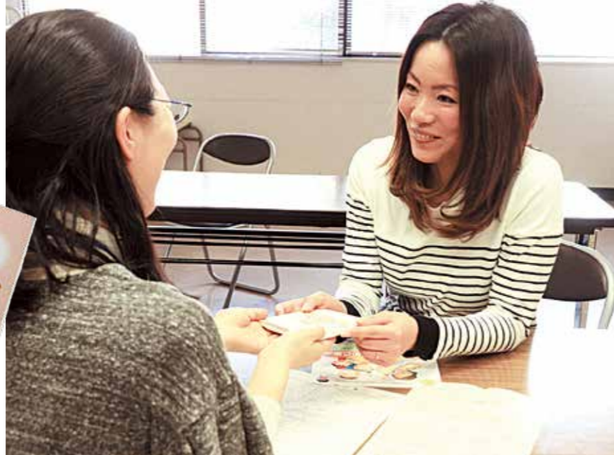
▲笑顔で母子健康手帳を受け取る妊婦さん