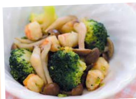
しめじとブロッコリーの バターしょうゆソテー 熱量(1人分): 53kcal、塩分: 0.9g

材料(4人分) ブロッコリー……………1/2株 しめじ……………1パック エビ……………4尾 バター……………10g しょうゆ……………小さじ2 砂糖……………小さじ1