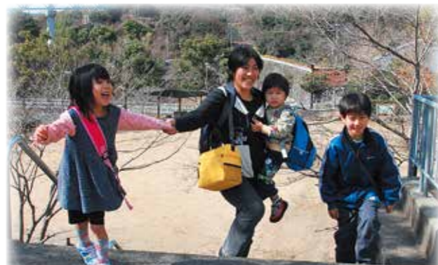
広報 わだにし 平成26年(2014年)4月号

春になると、陽気に誘われて何だかウキウキして、戸外に出る人が多くなりますね。おとも子どもも春の暖かさを感じて、外に出