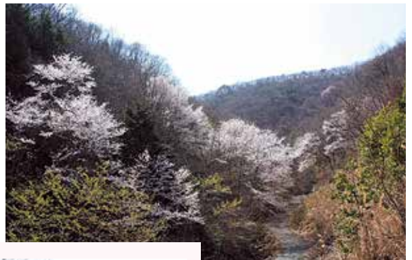
▷施設敷地内のエドヒガン群生地 (4月上旬頃)