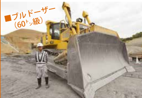
■ブルドーザー (60トン級)

硬い岩を掘削できる、新型のトンネル掘削機。世界に1台の特殊機械で、「さんたくん号」と命名された。全長27mと巨大な機体を、モニターを見ながらスイッチで操作する。