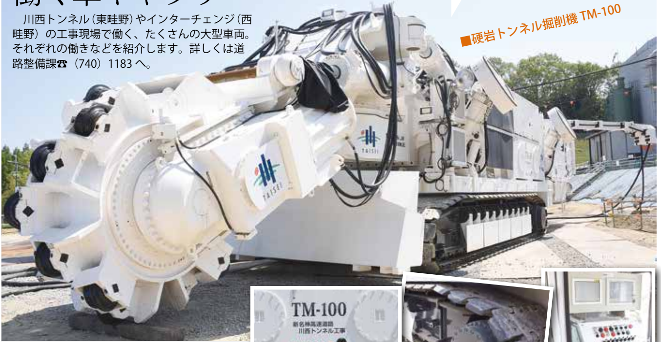
■硬岩トンネル掘削機 TM-100