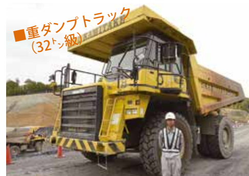
■重ダンプトラック (32トン級)