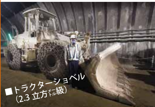
■トラクターショベル (2.3立方メートル級)