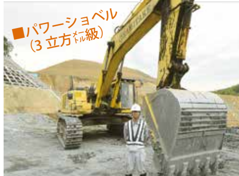
■パワーショベル (3立方メートル級)