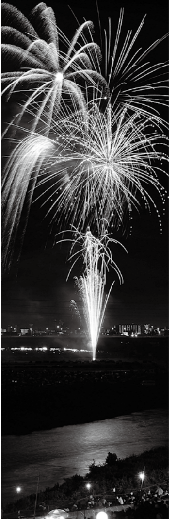
あんぱん を交まら かわに

8月15日(土) 午後7時20分～8時20分 ※荒天時は16日(日)に順延します @猪名川河川敷