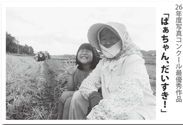
26年度写真コンクール最優秀作品 「ばあちゃん、だいすき！」