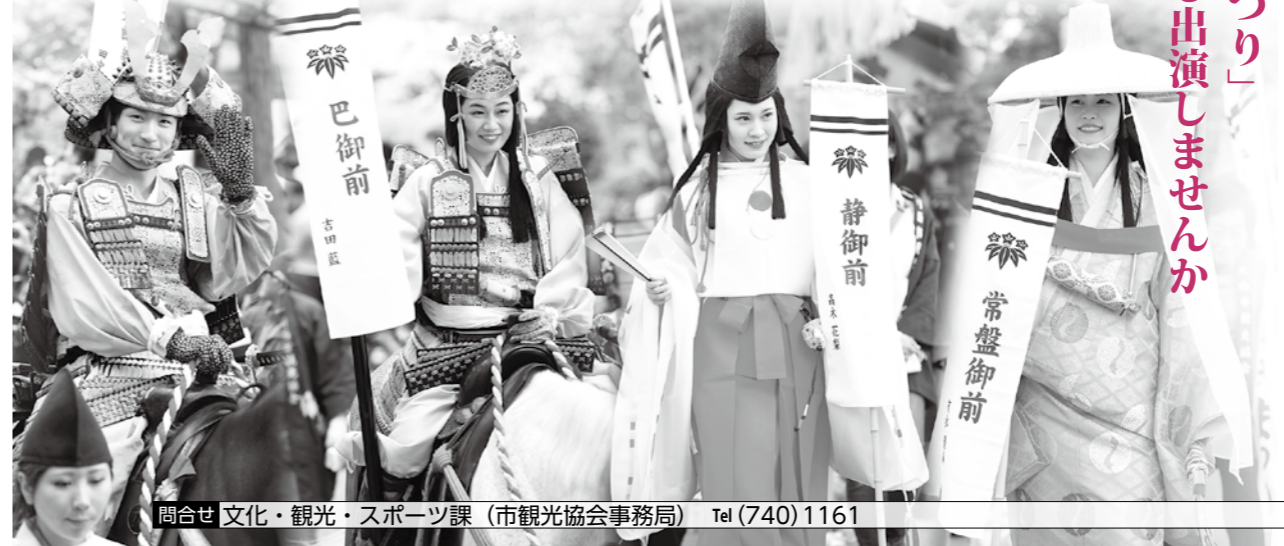
問合せ 文化・観光・スポーツ課(市観光協会事務局) Tel (740) 1161

3月12日現在、18〜30歳の女性で、源氏まじりの巴御前、常盤御前、静御前のほか、年間を通じて市や観光協会が行う各種イベントで活動できる3人。市観光協会から提供の副賞も進呈。