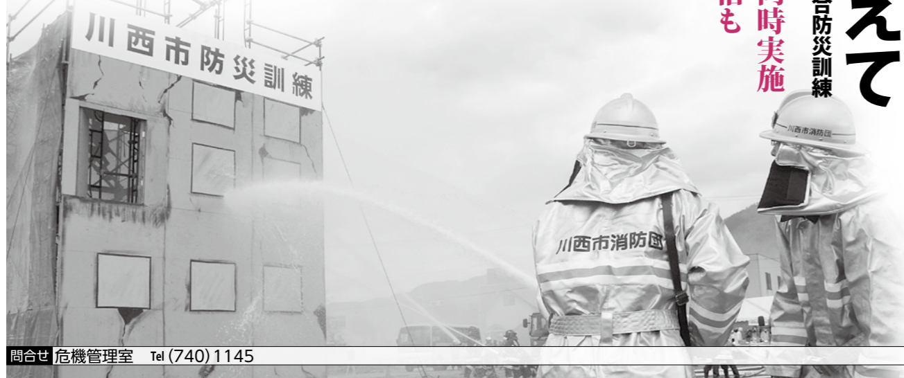
問合せ 危機管理室 Tel (740) 1145

1月24日(日)、午前10時5分ごろ、市内全域を対象として、エリアメール(N-TTドコモ)・緊急速報メール(a.u.ソフトバンク)の周知と、災害初期行動について考えるきっかけとするなど、防災意識を高めることを目的に一斉メール配信訓練を実施します(対応機種の人全員)。マナーモードなどでも受信音が鳴りますので、鳴ってはいけない場合は設定をオフにするか、電源を切るようにしてください。