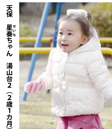
天保 星妻ちゃん 湯山台2 (2歳1カ月)

電車ってかっこいいよね。踏み切りの音が聞こえるだけでワクワクするんだ。ボール遊びも大好きだよ。