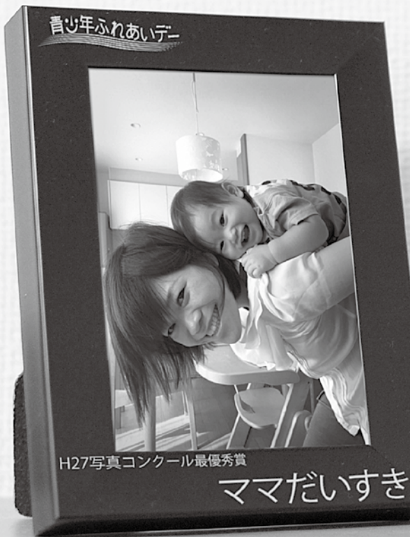
H27写真コンクール最優秀賞

日時 8月2日(火)午後1時～5時 場所 市民活動センター・男女共同参画センターなど 対象 小・中学生(保護者同伴) 定員 6組