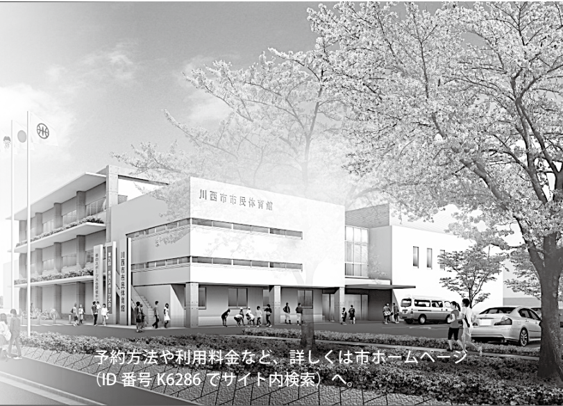
予約方法や利用料金など、詳しくは市ホームページ(ID番号K6286でサイト内検索)へ。

なお、利用予約は7月1日(金)から受け付けを開始。予約方法は旧市民体育館と同じです。